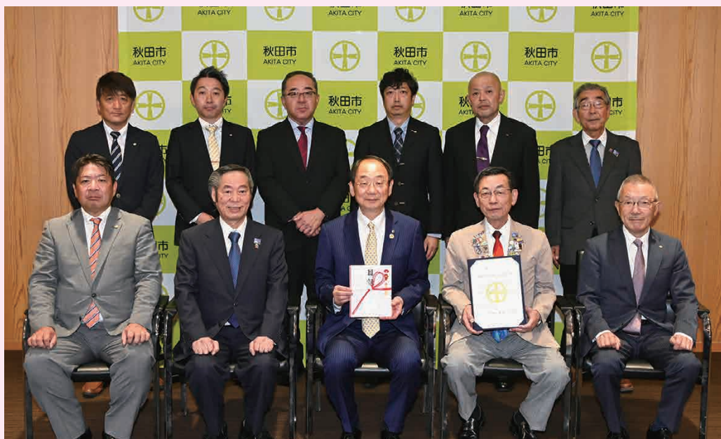
秋田市への支援金贈呈