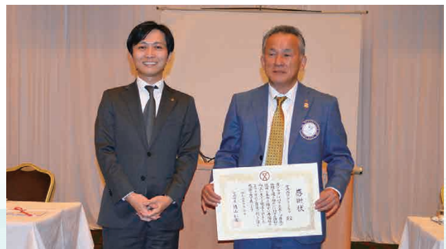
宮崎市長&宮崎西RC会長