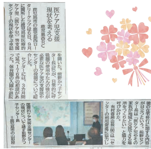
南日本新聞12月12日(火)掲載記事