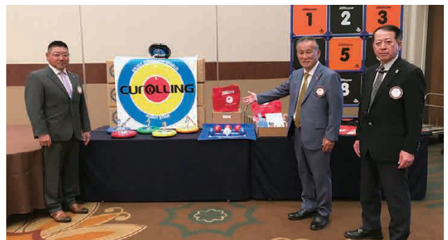
寄贈物(左:幹事 中央:会長 右:副会長)