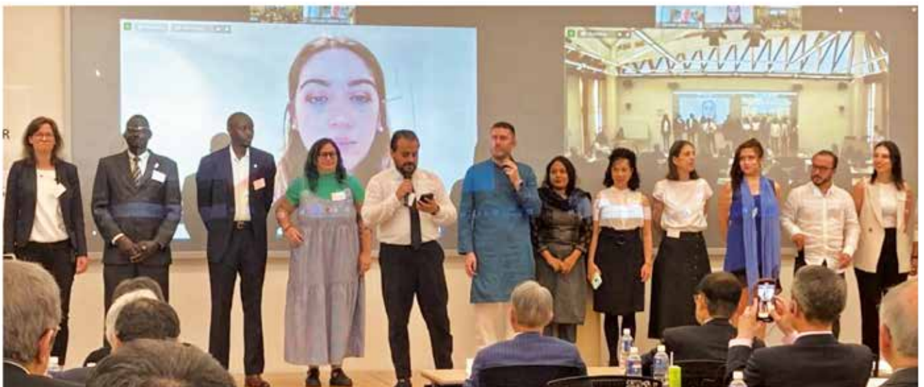
第20、21期平和フェローの自己紹介