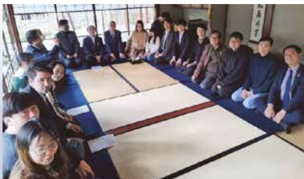
松涛庵で茶道を体験

茶道体験では、専門家が茶道の歴史や作法を解説し、参加者は茶会の趣を体感しながら茶道を知る機会となりました。続いて行われた新年