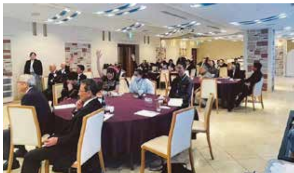
クイズ大会で手を挙げる参加者たち

12 月 8 日、国際ロータリー第 2640 地区米山学友会がイヤーエンドパーティーを開催し、現役奨学生・学友 27 人を含む、約 40 人が参加しました。