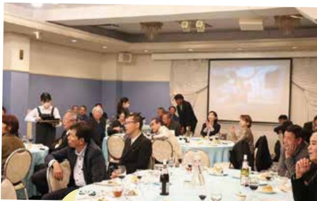
余興(プロマジシャンのショー)を楽しむ参加の皆様