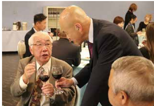
野中パストはじめ延岡市からお越しの役員の皆様