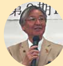
ガバナー開講あいさつ

12月17日(日)、都城東高校の教室をお借りして第9期RLI2730パートⅢを開催しました。 今回は41名に受講いただき、そのうち24名が卒業となりました。 RLIはパートⅠ、Ⅱ、Ⅲを修了すれば卒業となり、受講する順番や年度は自由です。 ロータリーをより広く、深く理解する絶好の場です。 皆様のご参加をお待ちしています。