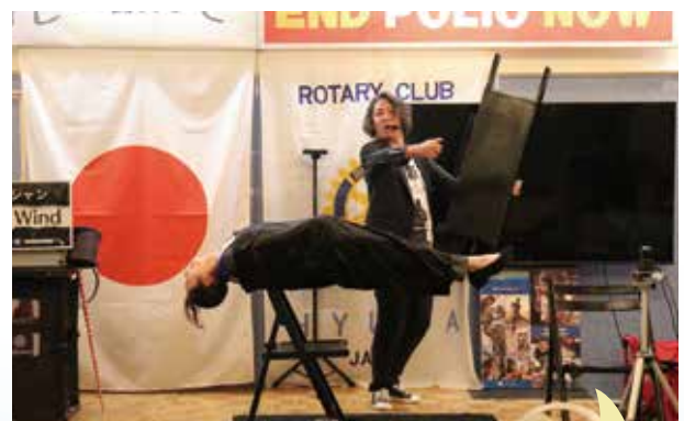
結構大がかりだったマジシャンのショー