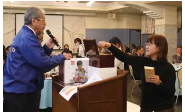
多数の寄付をいただきました