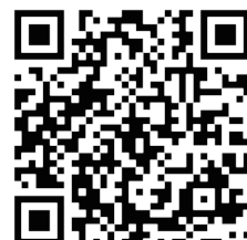
九南コーポレートサイト

宮崎本店 〒880-0912 宮崎市大字赤江 2 番地 TEL0985-56-5110 FAX0985-56-5125 都城本社 〒885-0004 都城市都北町 5070 番地 TEL0986-27-5600 FAX0986-27-5605