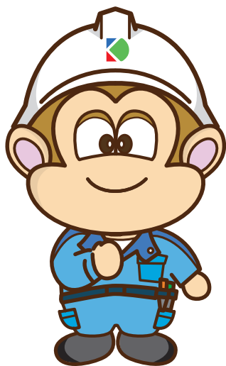
イメージキャラクター ゴキュー

～住まいのことなら、まかせて安心！～ 照明器具の取付からコンセントの増設、空調、 キッチン、お風呂、トイレのリニューアルまで 住まいのことなら全部おまかせ！