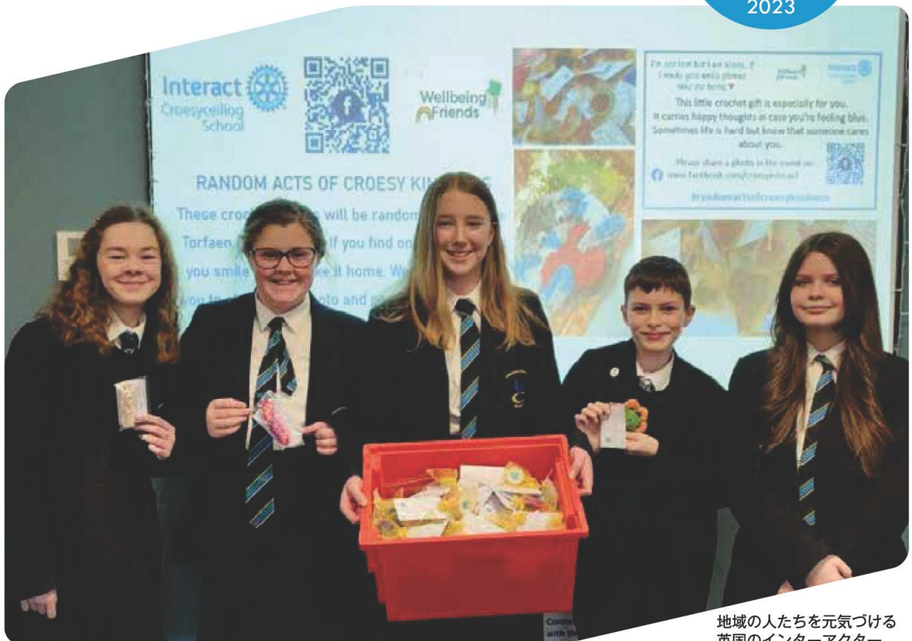
地域の人たちを元気づける 英国のインターアクター