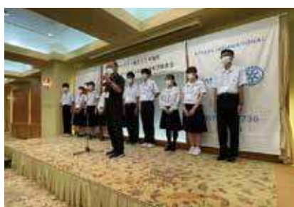
次年度開催地PR(鹿屋高校)