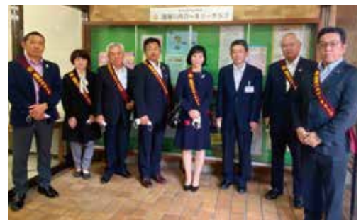
啓発用展示ショーケースの前で尾崎中央図書館長を囲んで