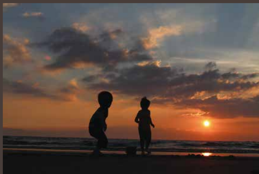
夕暮れのひととき ▲