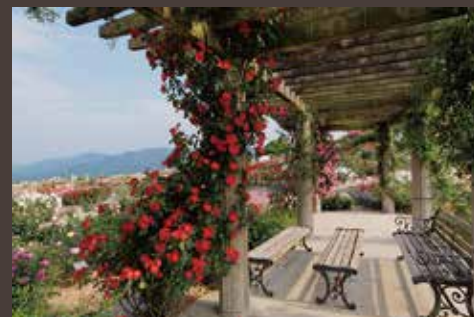
▲ 憧れのローズガーデン