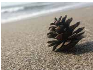
『凄凄切切』笠井 幸司 (延岡)