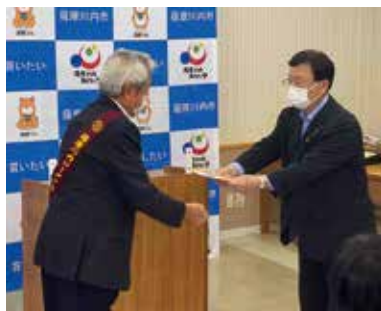
三角実行委員長より田中薩摩川内市長へ目録の贈呈

現在（6/9）、コロナ感染拡大防止のため図書館は閉館中ですが、市民の憩いの場である図書館に、更なる読書環境の充実が図られる資機材を寄贈したことで、健全な青少年育成に繋がると思っています。