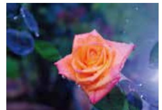
「ばら」と「海」フォトコンテスト（鹿屋市主催）