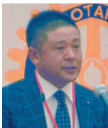
ライラ委員長挨拶