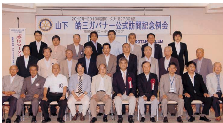
奄美中央RC公式訪問記念例会

12時30～例会。ガバナー・アドレスの後CLPについてフォーラムが行われました。