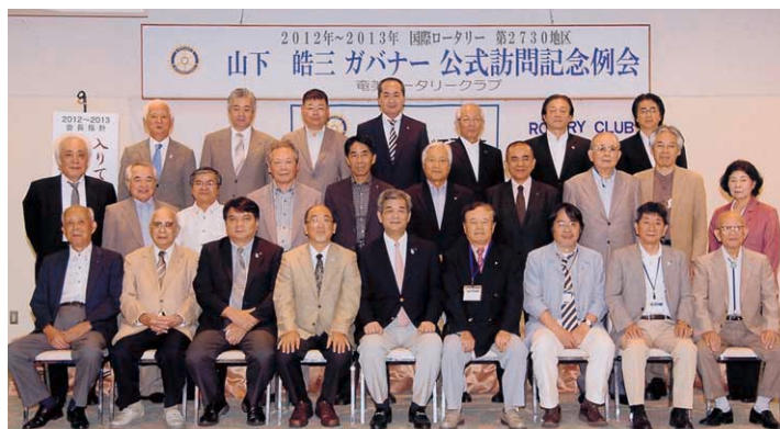
奄美RC公式訪問記念例会