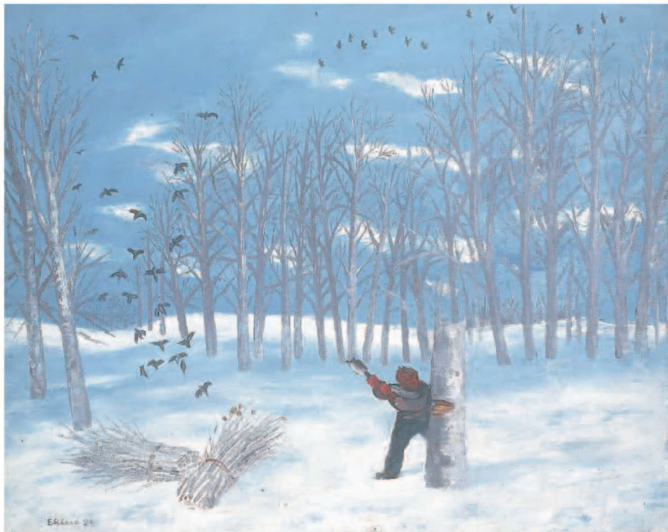
「樵夫」1928年／海老原喜之助