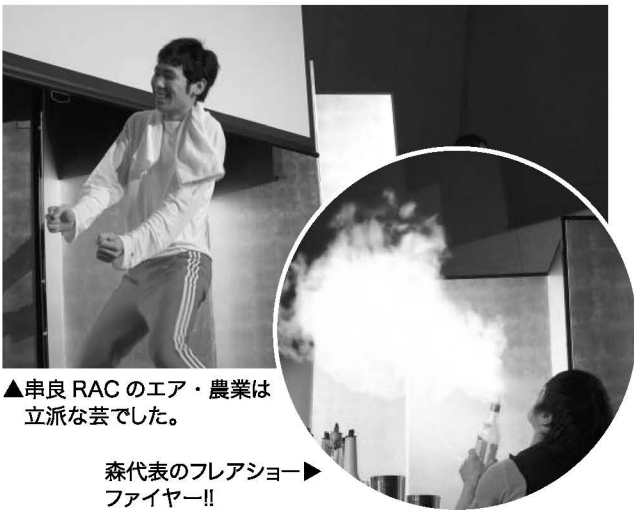
▲串良 RAC のエア・農業は立派な芸でした。