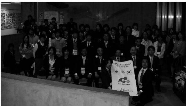
霧島自然ふれあいセンターにて集合写真