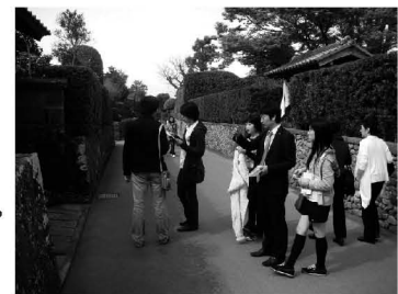
知覧 武家屋敷を散策