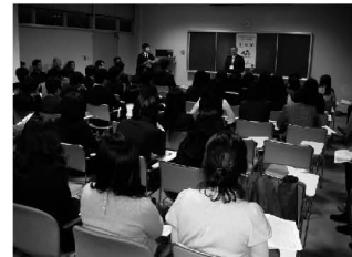
安満ガバナー歓迎の挨拶